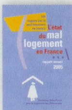
ILLUSTRATION F. LACHEZE.

Imaginée par une mère de famille, c'est la première société de maintenance informatique à domicile qui fonctionne 7 jours sur 7. Pour réparer, installer l'ordi de la maison ou apprendre à l'utiliser. Pour les habitants de Paris et de la région parisienne. > cielmonordi.fr .